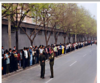
学员没有标语口号没有阻塞交通 等后十几个小时离开时把环境清理的干干净净。

答：1999 年 4 月 25 日，一万多名法轮功学员到国务院信访办上访，是因为 4 月 23 日在天津 40 多名学员被违法关押，地方政府告知没有北京的授权，学员得不到释放。学员们基于对政府的信任，用宪法 41 条赋予的上访权，本着善念，希望政府能公平对待法轮功。在获得朱镕基前总理的接见后，学员就平和地离去，离去时还把地上的垃圾全清理干净，所有事情圆满解决。