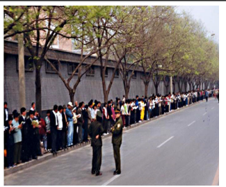
学员没有标语口号没有阻塞交通 等后十几个小时离开时把环境清理的干干净净。

答：1999 年 4 月 25 日，一万多名法轮功学员到国务院信访办上访，是因为 4 月 23 日在天津 40 多名学员被违法关押，地方政府告知没有北京的授权，学员得不到释放。学员们基于对政府的信任，用宪法 41 条赋予的上访权，本着善念，希望政府能公平对待法轮功。在获得朱镕基前总理的接见后，学员就平和地离去，离去时还把地上的垃圾全清理干净，所有事情圆满解决。