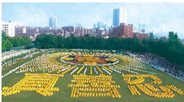
由5000多法轮功学员集体炼功，列队组成“法轮图形”和“真善忍”

◆ 1992年5月至1999年7月的七年间，法轮功靠人传人、心传心，传遍中国大江南北，据98年底中国政府的一项统计显示，全国炼法轮功者达7000万之众。