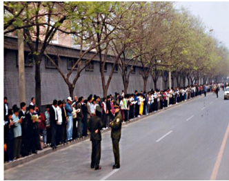
学员没有标语口号没有阻塞交通 等后十几个小时离开时把环境清理的干干净净。

答: 1999 年 4 月 25 日, 一万多名法轮功学员到国务院信访办上访, 是因为 4 月 23 日在天津 40 多名学员被违法关押, 地方政府告知没有北京的授权, 学员得不到释放。学员们基于对政府的信任, 用宪法 41 条赋予的上访权, 本着善念, 希望政府能公平对待法轮功。在获得朱镕基前总理的接见后, 学员就平和地离去, 离去时还把地上的垃圾全清理干净, 所有事情圆满解决。