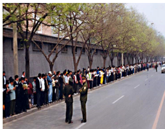
学员没有标语口号没有阻塞交通 等后十几个小时离开时把环境清理的干干净净。

答: 1999 年 4 月 25 日, 一万多名法轮功学员到国务院信访办上访, 是因为 4 月 23 日在天津 40 多名学员被违法关押, 地方政府告知没有北京的授权, 学员得不到释放。学员们基于对政府的信任, 用宪法 41 条赋予的上访权, 本着善念, 希望政府能公平对待法轮功。在获得朱镕基前总理的接见后, 学员就平和地离去, 离去时还把地上的垃圾全清理干净, 所有事情圆满解决。