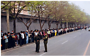
法轮功学员没有阻塞交通静静的站立等后十几个小时离开时把环境清理的干干净净

上访的起因是 4 月 23 日天津殴打、抓捕法轮功学员造成的。早在 96 年，把持政法、公安部门的罗干就开始刁难法轮功，因为修炼法轮功的人多，而且传播很快，江泽民就认为法轮功在