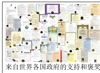
来自世界各国政府的支持和褒奖

法轮功在全世界获得的各国政府的褒奖；至 2003 年底已达到 1000 多个奖项，这是世界人民对“真、善、忍”的认同、也是对身处逆境的中国修炼者的支持。