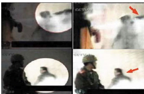
好人被害 天理不容 20 听我道来 同感惊骇

被非法关押了近半年，2001年7月，恶警再次去她家非法抓捕她，她在逃脱时不幸坠楼死亡。