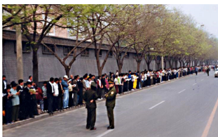
法轮功学员没有阻塞交通静静的站立等后十几个小时离开时把环境清理的干干净净

上访的起因是 4 月 23 日天津殴打、抓捕法轮功学员造成的。早在 96 年，把持政法、公安部门的罗干就开始刁难法轮功，因为修炼法轮功的人多，而且传播很快，江泽民就认为法轮功在