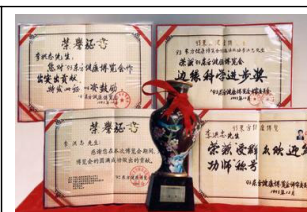
93 年东方健康博览会的褒奖