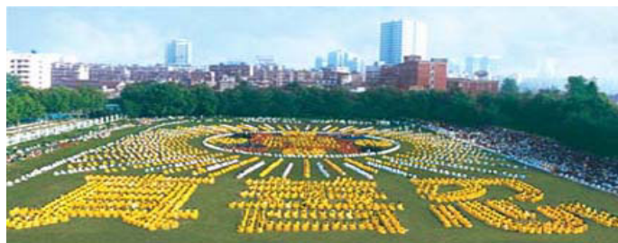
由 5000 多法轮功学员集体炼功，组成 “法轮图形”和“真善忍”（1997，湖北省武汉市）