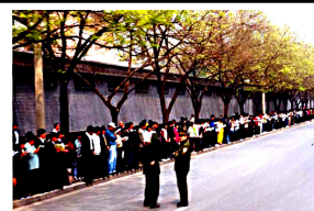
法轮功学员没有阻塞交通静静的站立等后十几个小时,离开时把环境清理的干干净净

4. 25 上访的地点, 是在北京市府右街的国务院信访办,而信访办的位置就在中南海的西门,如果信访办在其它地方,法轮功学员根本就不会去中南海。把 4. 25 上访称作“围攻中南海”事件,本身就是有意渲染的。再说,有这么“围攻”的吗?