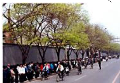
历史一瞬：4.25 和平上访

说来既简单又荒谬：4.25当晚，白天只坐在防弹车里匆匆“窥视”上访人群而没有采取任何正面举动的江泽民，无名妒忌难耐，模仿毛泽东当年写大字报发动文革之举，连夜给政治局写了一封信，强行以个人意志和非法手段，推翻政府总理当时的开明决定，将从96年暗中开始的对法轮功的迫害全面推向了公开化。这是中国法律的悲哀，更是二十世纪最大的扼杀希望和善良的邪恶之举。