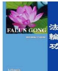
斯洛伐克文 《法轮功》正 式出版发行

法轮功自 92 年在中国传出，至今短短十一年间已传遍世界上六十多个国家，全球有上亿人修炼法轮功。修炼者按照“真、善、忍”修心向善，获得了健康的身体和高尚的道德。世界各国政府、机构对法轮大法颁发褒奖状，已达 1223 项。目前法轮功各种书籍已翻译成 30 多种语言文字，在世界各地发行，并可在网络上免费下载。