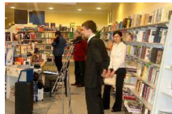
法轮功学员在斯洛伐克首都的书店为出版发行的斯洛伐克语《法轮功》举行了一场图书介绍会