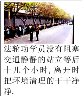
法轮功学员没有阻塞交通静静的站立等后十几个小时，离开时把环境清理的干干净净。