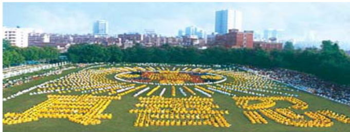
由 5000 多法轮功学员集体炼功，组成“法轮图形”和“真善忍”（1997，湖北省武汉市）