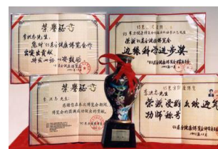
93 年东方健康博览会的褒奖

◇ 1998 年 9 月国家体总抽样调查法轮功学员 12553 人：痊愈和基本康复率为 77.5%。加上好转者人数 20.4%，祛病健身总数有效率高达 97.9%。被调查者的心理状况和精神状况也得到极大改善，他们所节约的医药费（平均每人每年 2600 元）为国家和集体创造了可观的经济效益。