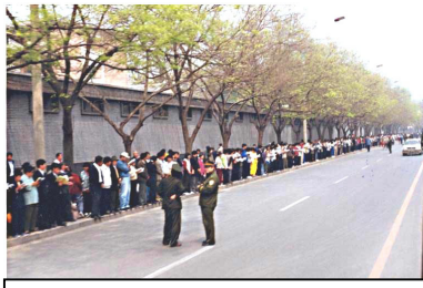
学员没有标语口号、没有阻塞交通，等候十几个小时。离开时还把环境清理干净。