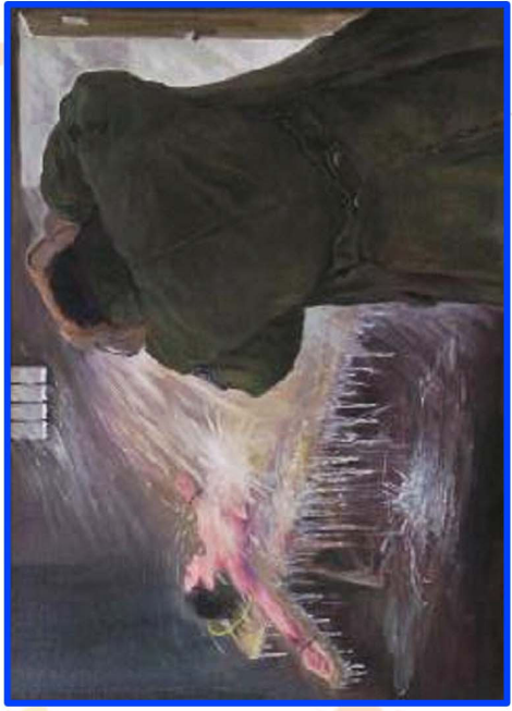
将人折磨昏死后再用冷水泼醒