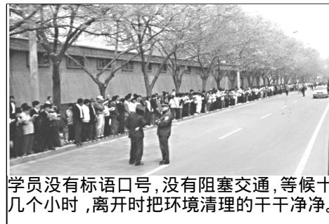
学员没有标语口号，没有阻塞交通，等候十几个小时，离开时把环境清理的干干净净。

99 年 4 月 23 日，由罗干和其连襟何祚庥一起策划的“天津抓人打人事件”由于警察肆意殴打及抓捕学员，公安部介入天津市政府，并告知无北京授权不放人，建议学员去北京上访。