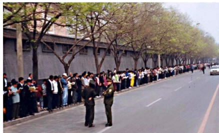
“4.25”上访，法轮功学员没有阻塞交通，静静的站立等候十几个小时。

也是很多对大法不了解的人有想法的地方。其实你静下心来想一想，如果法轮功对国家对人民的好处是那么多的，那么当他受到不正确对待的时候，受益者完全是以和平、理性、善意的向政府机关说明情况，难道人多就不行上访吗！到中南海附近的国务院信访办上访，就说是“围攻中南海”对吗！而且当天朱镕基总理接见了学员代表，重申了国家不会干涉群众炼功的政策。当晚10点，学员们静静离去。整个过程，平静祥和，秩序井然。这难道就叫“围”“攻”中南海吗！