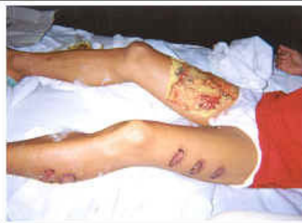
火烫烧烙：此刑极其狠毒残忍，很多法轮功学员被恶警用烟头在脸上烧烙，留下满脸的焦黑疤痕。尤为残忍的是少数极恶毒的警察还在年轻女学员的脸上烧烫以毁其容貌，其毒辣手段连纳粹分子都望尘莫及。