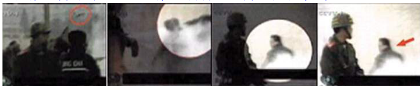
(击打者仍保持用力姿势)

害，于是从 99 年 7.20 开始，一场铺天盖地来势凶猛的大造谣开始了。整个迫害都是以谎言为基础的，如果你已经看到过一些相关资料，相信谁是谁非、谁真谁假、一目了然。