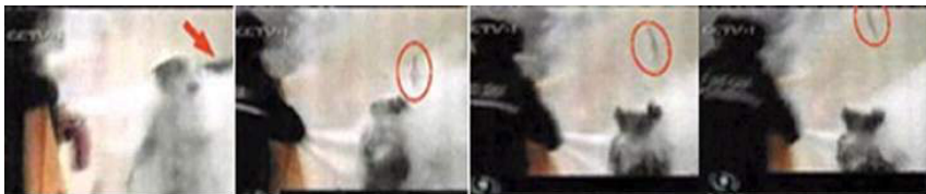
(刘头部受到一记重击，击打后重物飞越人头顶)