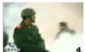
4、击打者仍保持用力姿势