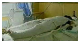
记者未穿防护服,采访无任何防护措施“烧伤者”