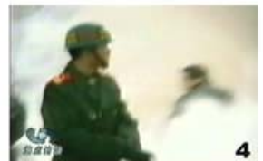
4、击打者仍保持用力姿势