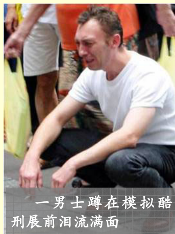
一男士蹲在模拟酷刑展前泪流满面