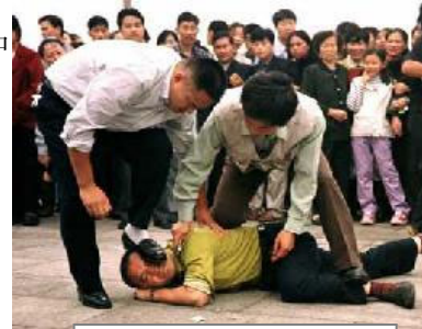
警察在天安门广场对法轮功学员施暴