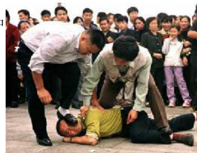
警察在天安门广场对法轮功学员施暴