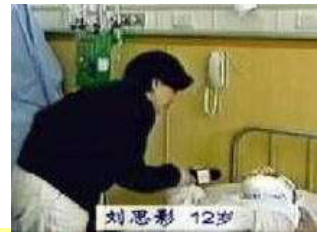
图 2：中央台“天安门自焚案”中的“烧伤病人”及采访

《转法轮》获得第 14 名的排行。在 100 本最受欢迎书籍中，《转法轮》是唯一来自东方的气功修炼书籍。◇