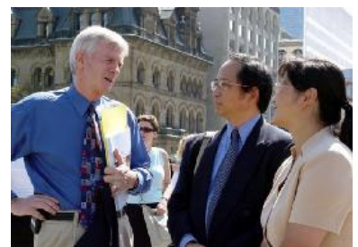
图为国会议员大卫-乔高 同法轮功学员在一起

加拿大资深议员大卫-乔高在新闻发布会上支持停止迫害，并希望加拿大政府禁止参与迫害的中共官员薄熙来和夏德仁进入加拿大。