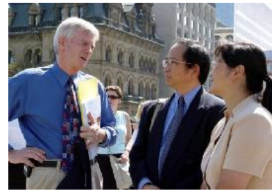
图为国会议员大卫-乔高 同法轮功学员在一起

加拿大资深议员大卫-乔高在新闻发布会上支持停止迫害，并希望加拿大政府禁止参与迫害的中共官员薄熙来和夏德仁进入加拿大。