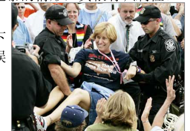
“反战母亲”被捕时还面带微笑。