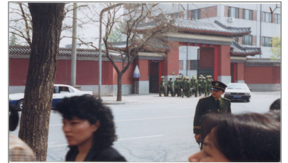
上访群众和中南海西门（可看到紫禁城的红围墙）隔街相望

理性的百姓得到了理性总理的会见，在得到释放被抓学员的承诺后，他们静静散去。国际评论称这是中国政民对话上访史上规模最大、最理性、最平和，也最圆满的