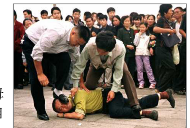
警察在天安门广场对法轮功学员施暴