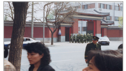
上访群众和中南海西门（可看到紫禁城的红围墙）隔街相望

理性的百姓得到了理性总理的会见，在得到释放被抓学员的承诺后，他们静静散去。国际评论称这是中国政民对话上访史上规模最大、最理性、最平和，也最圆满的