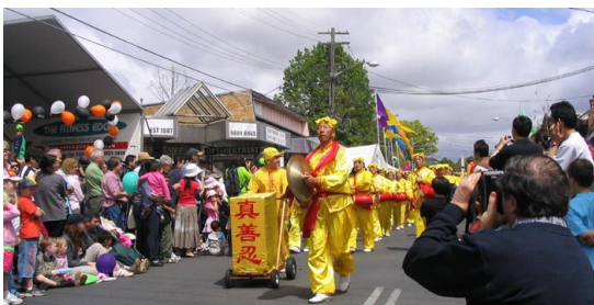
雄姿勃勃的腰鼓队