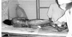
真正的烧伤病人要在空气中晾着，护理人员要穿卫生服，戴口罩防感染。