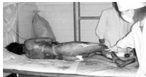
真正的烧伤病人要在空气中晾着，护理人员要穿卫生服，戴口罩防感染。