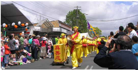
雄姿勃勃的腰鼓队