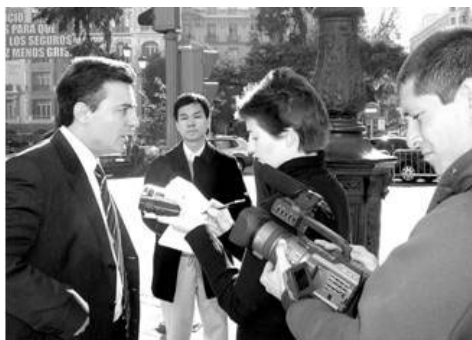
媒体采访伊克雷西亚斯律师

【明慧网】2005 年 11 月 8 日，15 名因修炼法轮功而遭中共迫害的受害者，委托西班牙著名人权律师伊克雷西亚斯，向西班牙国家法院起诉现任中共商业部长薄熙来，指控他因积极参与迫害法轮功，犯有群体灭绝和酷刑罪。