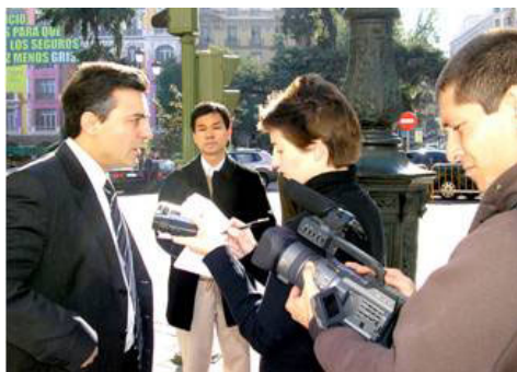
媒体采访伊克雷西亚斯律师

【明慧网】2005 年 11 月 8 日，15 名因修炼法轮功而遭中共迫害的受害者，委托西班牙著名人权律师伊克雷西亚斯，向西班牙国家法院起诉现任中共商业部长薄熙来，指控他因积极参与迫害法轮功，犯有群体灭绝和酷刑罪。