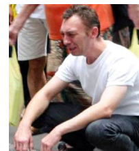
一男士蹲在模拟酷刑展前泪流满面

曾经，没有人相信法轮功弟子是在受到残酷恶毒的迫害，没有人知道法轮功弟子遭受的迫害残酷到多么的惊人程度，没有人相信法轮功最终能够走过来。而当法轮功弟子走过来之后，把残酷的迫害真实的