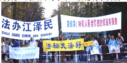
法轮功学员呼吁停止对法轮功的迫害

法轮功学员们一如既往和平请愿，表达停止迫害的心声。7日至10日夜晩，英国天气寒冷。法轮功学员们不畏寒冷，静静的在胡锦涛下榻宾馆外举行了72小时烛光请愿，呼吁停止迫害法轮功。法轮功学员的祥和坚韧感动了当地警民。一位英国警察说：“你们能触动人的心灵。”