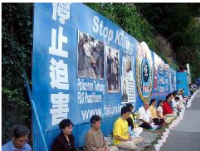
中领馆前请愿四周年▲

那些在中领馆前长期请愿的法轮功学员，无论严寒酷暑，无论大雨倾盆，无论多少冷言冷语，无论多少仇视怪怨，他们都在无怨无恨的理性平和中坚持着。他们的坚韧和善良，他们为制止这场非人迫害所付出的一切，深深打动着每一个了解此事的人。连中领馆内部的人都在私下对法轮功学员说，你们要坚持下去。应该说，刚开始的时