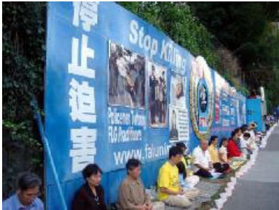
中领馆前请愿四周年▲

那些在中领馆前长期请愿的法轮功学员，无论严寒酷暑，无论大雨倾盆，无论多少冷言冷语，无论多少仇视怪怨，他们都在无怨无恨的理性平和中坚持着。他们的坚韧和善良，他们为制止这场非人迫害所付出的一切，深深打动着每一个了解此事的人。连中领馆内部的人都在私下对法轮功学员说，你们要坚持下去。应该说，刚开始的时