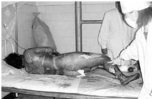
真正的烧伤病人要在空气中晾着，护理人员要穿卫生服，戴口罩防感染。