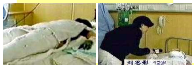
中央台“天安门自焚案”中的“烧伤病人”及采访