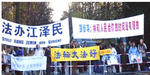
法轮功学员呼吁停止对法轮功的迫害

11月10日和11日胡锦涛访问德国期间，来自德、法、意、奥、挪威、丹麦、瑞典、瑞士、荷兰的法轮功