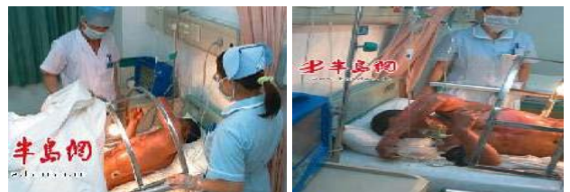
青岛闪电烧伤病人在抢救中