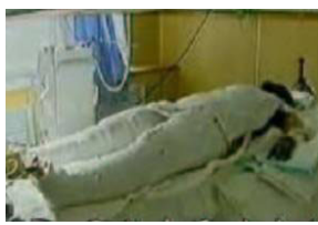
央视《焦点访谈》中的“自焚者”被包裹严密。

日在联合国会议上声明指出：“中共当局企图以自焚事件为证据诬陷法轮功，而我们得到的录像分析表明，整个事件是中共当局一手编造、导演的。”