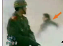
1、刘头部受到一记重击 2、击打后飞出的重物 3、重物飞越人头 4、击打者仍保持用力姿势