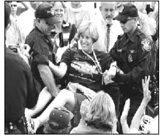
当地时间9月26日,“反战母亲”希恩被捕时还面带微笑。