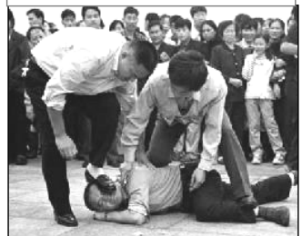
警察在天安门广场对法轮功学员施暴

不要向恶势力低头,勇敢的维护自己的合法权益,向省、市有关部门反映依兰当局的错误做法,纠正和制止他们的错误行为。哈尔滨市市长接待热线电话号码: 84612345