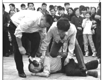
警察在天安门广场对法轮功学员施暴