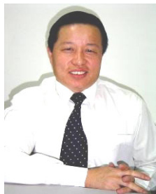
中国著名律师 高智晟

【明慧网】美国之音 10 月 19 日报导，中国著名律师高智晟发表致中共领导人胡锦涛、温家宝的公开信，要求中共当局结束对法轮功的“野蛮”迫害。高智晟对记者表示，作为一名律师，他现在在中国不能通过法律形式而只能通过公开信的形式，试图维护法轮功成员的基本人权和公民权。