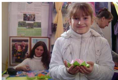
象征修炼人出淤泥而不染的莲花深受喜爱

2005 年 10 月中旬，俄罗斯下诺夫果勒德城的“回归自我之路”健康展中，介绍法轮大法的图片展板吸引了众多的观众，人们高兴的索取法轮功真象传单和漂亮的纸折莲花，对法轮功功法饶有兴趣