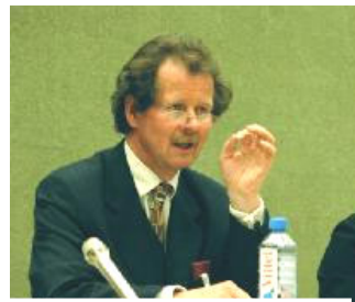
联合国“酷刑问题”特派专员曼夫德·诺瓦可先生

曼夫德·诺瓦可先生还对中共在他整个行程中的干扰提出抗议。中共不仅派人跟踪，监视，骚扰他们的正常考查计划，而且威胁与恐吓向他们提供证据的当事人及家人。