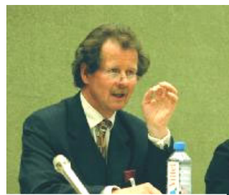
联合国“酷刑问题”特派专员曼夫德·诺瓦可先生

曼夫德·诺瓦可先生还对中共在他整个行程中的干扰提出抗议。中共不仅派人跟踪，监视，骚扰他们的正常考查计划，而且威胁与恐吓向他们提供证据的当事人及家人。