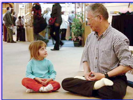
上图：善良无罪，修炼无罪。

一天午后，他正在躺椅上打盹，朦胧之中，忽见一位银须白发老翁，手拿拂尘飘然来到他的跟前，对他说：“我乃药神是也，统管天下采药卖药之人，你近来掺卖劣质药材，坑害病人，现在无人买药，就是对你的惩罚。”说罢，给他丢下一张纸条，遂又飘然而去。他急忙拾起纸条一看，原来是一首