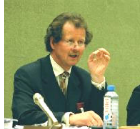
联合国“酷刑问题”特派专员曼夫德·诺瓦可先生

【明慧网 2005 年 12 月 3 日】联合国“酷刑问题”特派专员于 12 月 2 日结束了他在中国的两个星期的关于酷刑问题的实地调查。于当日在北京召开新闻发布会，会上，特派专员谴责酷刑问题在中国非常普遍，而且滥用酷刑遍及全国，中国政府应该遵循国际人权基本准则，