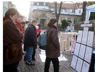
步行街上人们驻足观看反酷刑展