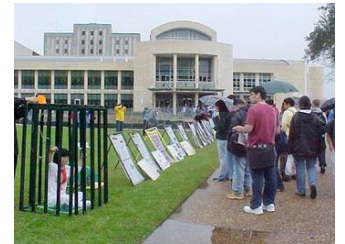
真人模拟及图片展示酷刑迫害

【明慧网】法轮功学员于2005年2月7日在休斯敦大学草坪上举行反酷刑展，揭露江氏集团对法轮功的残酷迫害，人们冒雨观看。