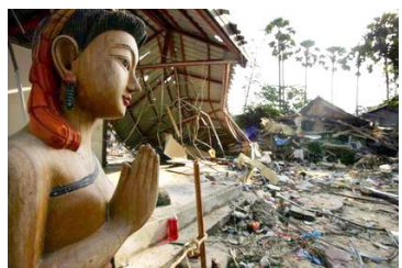
一尊完整的泰国木雕佛像站立在泰国普吉岛一间被毁坏的潜水商店前

在大灾难面前，人类是那样束手无策，在变化万千的宇宙中，人类不解其因，三百年来，西方的实证科学和近代的功利主义，障住了人类的眼睛，扼制了人类与生俱来与天地相通的灵性，扭曲了人类的智慧。在这浩瀚的宇宙中，人是多么渺小，不论人类有多么伟大的创造，在天地间却不堪一击。无怪乎中国自古以来就有修炼的文化和传统。参透人生究竟、超越生死，是智者通过修炼才能达到的境界。