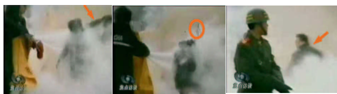
1，刘头部受重击 2，击打后飞出的重物