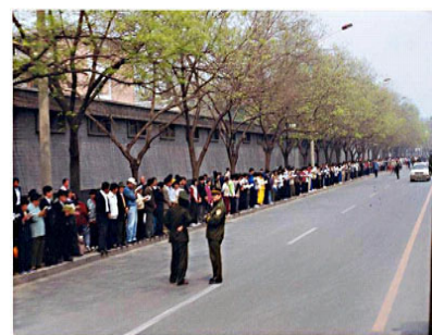
上访学员安静祥和

海西门。如果信访办在其它地方,法轮功学员根本就不会去中南海。罗干设下圈套,事先封闭各路口唯独留下中南海一条路,公安刻意诱导学员分为两路把中南海围成一圈形成所谓的“包围中南海”进行栽赃陷害。