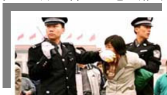
人们说真话的权利被剥夺了

比如说你的家人被迫害了, 你不找他评理吗? 你找他评理时, 他就说你参与了政治, 那有这样的道理啊?