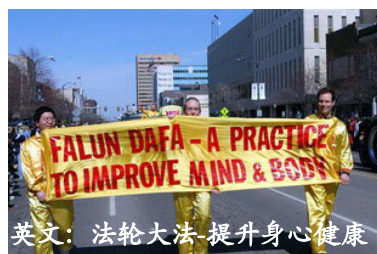
英文: 法轮大法-提升身心健康

加拿大法轮功学员参加了蒙特利尔市的游行。大约有 30 万人观看。法轮功队伍所到之处, 观众不断发出热烈的掌声和欢呼声。就象活动纪念主题一样, 法轮功学员也把法轮大法 “真善忍” 的美好带给了全世界的人们。加拿大总理保罗马丁也前来参加游行。据报道, 马丁总理在 2 月份出访中国归来后, 曾以快件的方式寄信给法轮大法学会, 信中介绍说在访华期间, 总理在多种场合谈