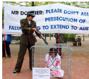
澳洲外交部前演示迫害