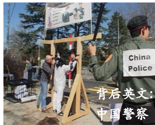
背后英文： 中国警察

海外举办的“九评”研讨会四百多场，且场场爆满。3 月 19 日在华盛顿国会山庄更是举行了“退出中共”大集会，庆祝退党人数突破 37 万。各地退党服务中心也应运而生。《九评》已被翻译成多国语言全球发行。民众亦可通过互联网免费下载。