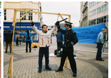
在利物浦演示对学员的酷刑