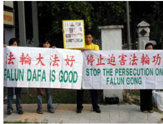
马来西亚中国驻马大使馆前