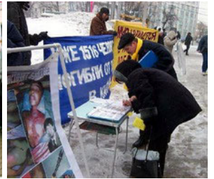
莫斯科民众纷纷签名