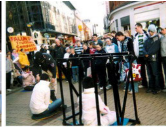
北爱尔兰首府贝尔法斯特