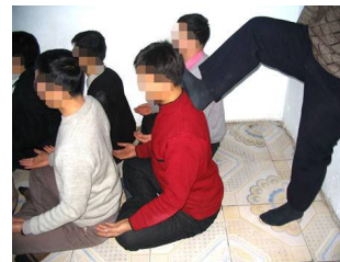
演示图 2：坐板遭脚踹