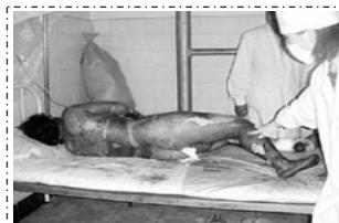
烧伤病人要在空气中晾着，护理人员要穿卫生服，戴口罩以防感染。

深度烧伤住院必须住隔离病房，住无菌室，要有专门的医护人员治疗和护理，医护人员必须穿高温消毒的防护衣和戴消毒口罩，无菌病房绝不允许不穿防护衣的人员踏入一步，整个治疗过程都是一丝不挂的，医生说：烧伤以后，身体内部发热，身体表面不能缠绷带，否则，体内的热气、毒气会导致人死亡。