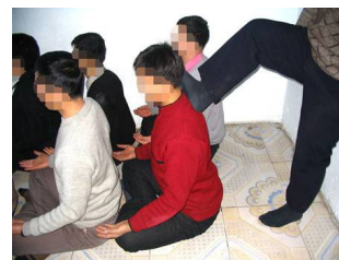
演示图 2：坐板遭脚踹