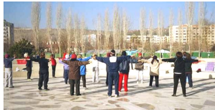
土耳其安卡拉一个炼功点的晨炼