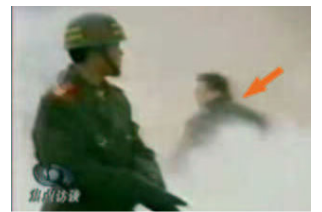
穿着军大衣的凶手(背影)

自焚真象震撼了荷兰电视观众的心。国家电视台的这个节目播出之后，很多荷兰人接到法轮功真象资料时会高兴地说：“我看电视了，谢谢你们。”还有很多人找到学员们，想学炼法轮功。