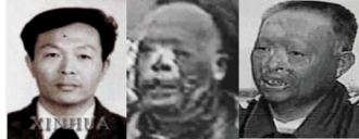
这是一个王进东 还这是三王进东