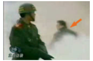
穿着军大衣的凶手(背影)

自焚真象震撼了荷兰电视观众的心。国家电视台的这个节目播出之后，很多荷兰人接到法轮功真象资料时会高兴地说：“我看电视了，谢谢你们。”还有很多人找到学员们，想学炼法轮功。