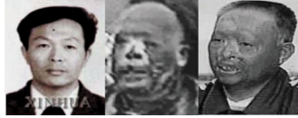
这是一个王进东 还这是三王进东