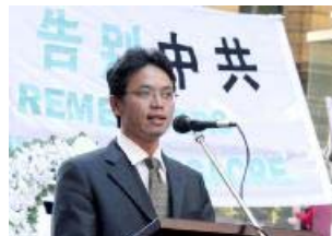
图：中共驻澳洲外交官 陈用林宣布退出共产党

在其递交给澳洲移民局的庇护申请信中说，在他过去任职的四年中，因为用“邪恶的方式”为当局工作帮助迫害法轮功学员而产生的罪恶感，使他频频处于噩梦之中而“华发早生”。陈说，“如果我回到中国，一定会因为我有处理涉及法轮功问题的经验而继续负责法轮功问题。与其被迫这样做，我宁愿死去。”