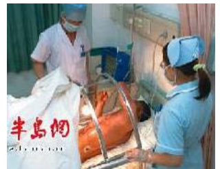
图一：青岛闪电烧伤病人在抢救中