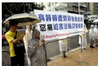
香港學員冒雨在中聯辦外宣 读声明，要求严惩兇手

功的镇压已经失去理智，在高蓉蓉被毁容的照片已全世界皆知、并震惊的情况下，中共不顾国家形象，反而施以疯狂报复，足见其嗜血的本性。