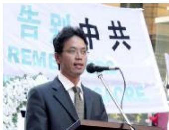
图：中共驻澳洲外交官 陈用林宣布退出共产党

陈说，“如果我回到中国，一定会因为我有处理涉及法轮功问题的经验而继续负责法轮功问题。与其被迫这样做，我宁愿死去。”