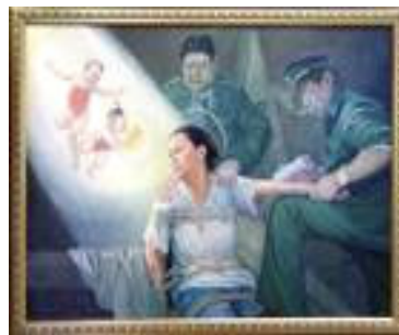
“坚忍不屈的精神”画展作品：光明与黑暗

开展的第一天，众多来自欧盟 25 个成员国的官员及欧洲议会的工作人员前来欣赏，不少人流连忘返，有的还特意回来再次观赏。很多人被作品所表现的境界所震撼，赞叹不绝。有的表示不敢相信，中国竟然仍在发生这么残酷的迫害。