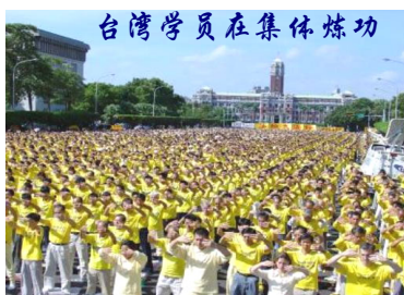
台湾学员在集体炼功

大法书籍被译成三十多文字，在世界各地出版发行。主要著作《转法轮》已被译成 25 种文字，截至 2005 年 7 月，收到来自世界各国政府