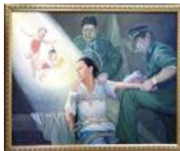
“坚忍不屈的精神”画展作品：光明与黑暗

开展的第一天，众多来自欧盟 25 个成员国的官员及欧洲议会的工作人员前来欣赏，不少人流连忘返，有的还特意回来再次观赏。很多人被作品所表现的境界所震撼，赞叹不绝。有的表示不敢相信，中国竟然仍在发生这么残酷的迫害。