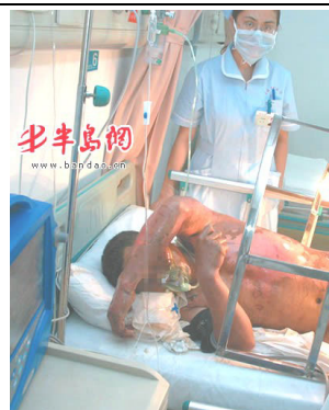
青岛闪电烧伤病人在抢救中

人们在对此次受难者深表关切的同时，细心者更是从新闻报道中恍然大悟，发觉四年前 CCTV 曾大肆报道的所谓“天安门自焚案”确实大有蹊跷。