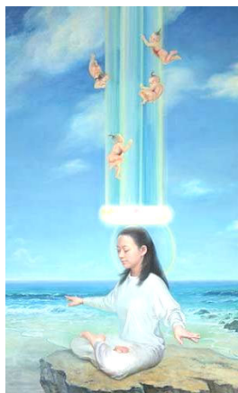
「天人合一」表现了修炼的美好