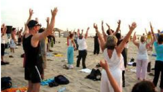
以色列人学炼法轮功，在特拉维夫海滩成时尚