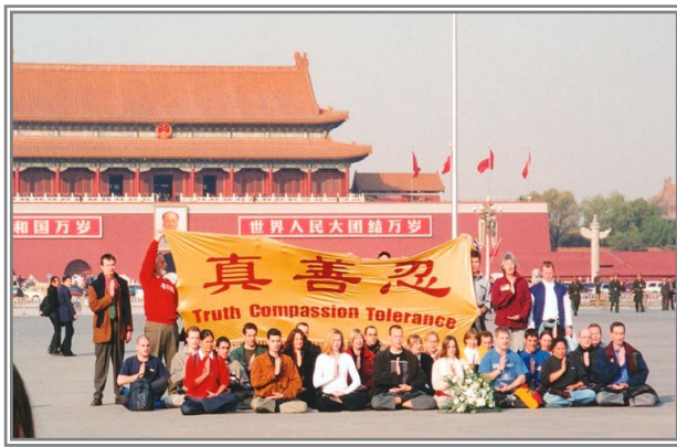
2001 年 11 月，36 名西方法轮功学员到天安门广场，展开写有“真善忍”的横幅，为法轮功和平请愿。

女客人又说起 99 年开始迫害法轮功的事。“这么多年，就没见过象法轮功这么文明、有秩序上访的。4.25 的时候，人都站在街两边，一点儿不阻碍交通。中央一说不干涉群众炼功，人家就悄悄散了。走后地上连张废纸都