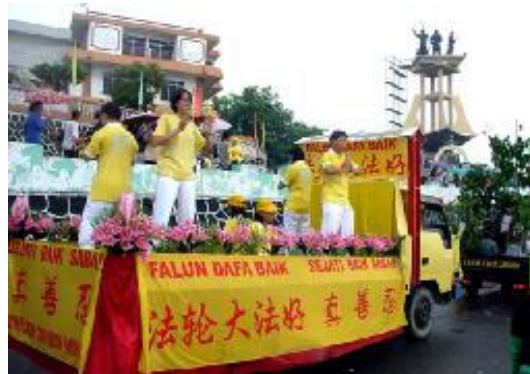
印尼学员的功法演示活动车

【明慧网 2005 年 8 月 26 日】2005 年 8 月 17 日，是印度尼西亚独立 60 周年纪念日。按照惯例，国庆日的周末会举行游行仪式，今年也不例外，8 月 20 日在印度尼西亚的丹绒兵让岛 (TG. Pinang) 举行了该岛的国庆游行。新加坡和印度尼西亚的法轮功学员以腰鼓队和功法演示两个方阵参加了这次游行。