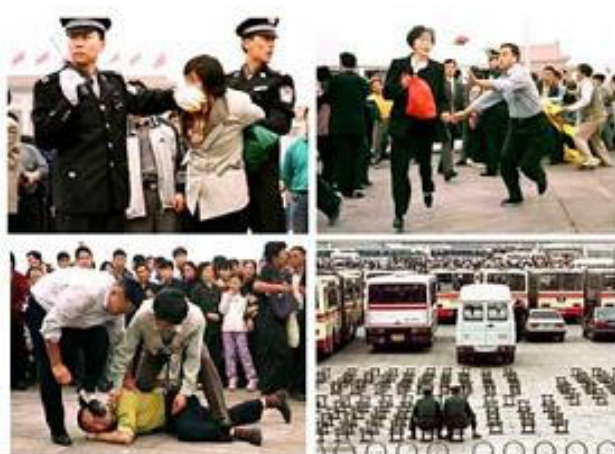
阳光下的罪恶——发生在天安门广场