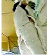
“天安门自焚案”中的“烧伤病人”