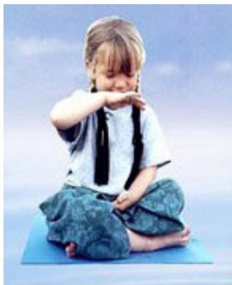
国外法轮功小弟子

东西，连维持生活的土地也卖了，作为农民没有土地将意味着什么，人人都会明白。在这个社会里老百姓根本就付不起这高昂的医疗费，在医大二院住了四十天，大夫说：你们农民也没有钱，即使有钱