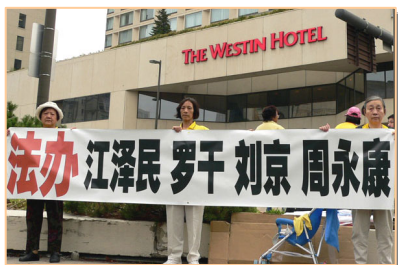
法轮功学员在胡锦涛下榻的 WESTIN 酒店前请愿

2005 年 9 月 8 日上午，胡锦涛率团在暴风雨中抵达加拿大首都渥太华。来自加拿大各大城市和美国部份城市的数百名法轮功学员在机场、胡下榻的旅馆和总督办