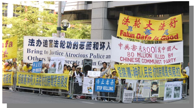
来自加拿大各地及部份美国地区约 500 多位法轮功学员在胡下榻的洲际旅店前进行停止迫害的和平呼吁。

原本随胡一行出访者中的商业部长薄熙来这次没有出现在出访人员名单之中，薄熙来曾任职大连市市长、辽宁省省长，其任职期间辽宁省成为迫害法轮功最严重的省份之一。鉴于薄熙来迫害法轮功情节的严重