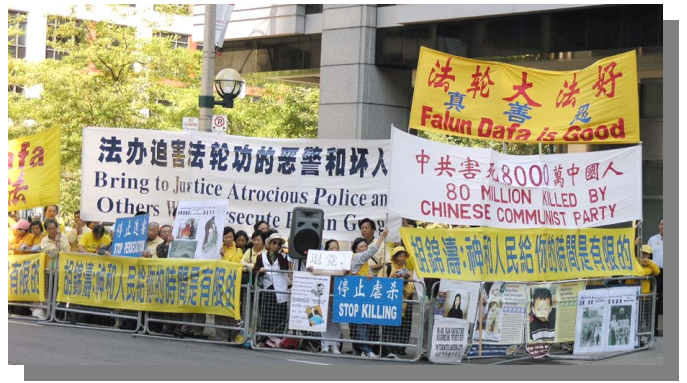
来自加拿大各地及部份美国地区约 500 多位法轮功学员在胡下榻的洲际旅店前进行停止迫害的和平呼吁。

修炼后半年多的时间，99年的7月20日，江泽民对法轮功的迫害开始了。柳州市委、市政府、公安局、各城区、单位、街道办事处，对大法弟子进行轮番的