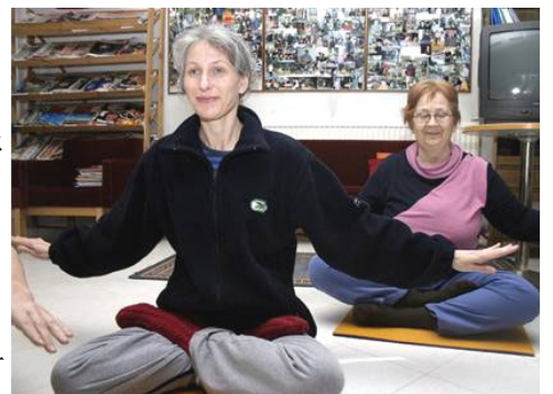
芬兰人在学炼法轮功第五套功法

芬兰Karjalan Heili报于2月23日刊登采访报道和图片。报导说，在芬兰的公园里常可以看到法轮功的踪迹。法轮功在中国曾经非常受欢迎，但是中共在1999年开始镇压法轮功。至今，已有超过2740名法轮功学员被证实因迫害致死。报导还说，气候寒冷时，炼法轮功可以使身体保持温暖。法轮功根据“真、善、忍”法理修炼心性，共有五套动作舒缓的功法，其中四套是动功，第五套则是静功打坐。报导说，法轮功现在已经洪传到70多个国家。