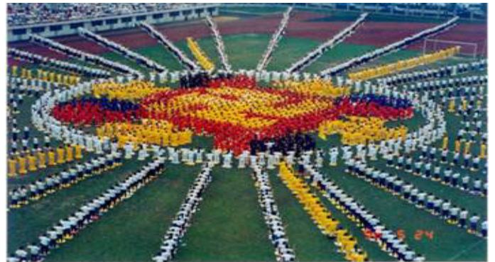
1996 年，武汉，约 5000 名法轮功学员集体炼功，列队组成辉煌的法轮图形

【明慧网】法轮大法自 1992 年 5 月从长春传出至今，已经传遍亚太地区、北美、南美、欧洲绝大部分地区，以及非洲的部份国家，据不完全统计，法轮大法已洪传近 80 个国家（地区）。在全世界，不同种族肤色的法轮功修炼者已超过一亿，法轮大法主要著作《转法轮》等，已被翻译成 30 种语言在世界各地出版发行，法轮大法因其“真善忍”法理带给世界的美好，收到世界各国政府机构、议员、团体组织等对法轮大法和创始人的褒奖、支持议案和信函已达 2592 项。