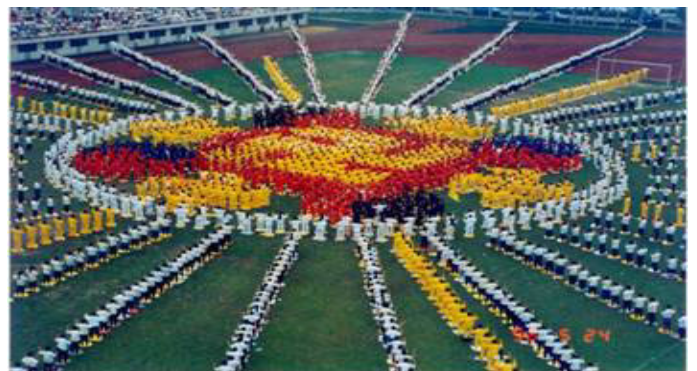
1996 年，武汉，约 5000 名法轮功学员集体炼功，列队组成辉煌的法轮图形

【明慧网】法轮大法自 1992 年 5 月从长春传出至今，已经传遍亚太地区、北美、南美、欧洲绝大部分地区，以及非洲的部份国家，据不完全统计，法轮大法已洪传近 80 个国家（地区）。在全世界，不同种族肤色的法轮功修炼者已超过一亿，法轮大法主要著作《转法轮》等，已被翻译成 30 种语言在世界各地出版发行，法轮大法因其“真善忍”法理带给世界的美好，收到世界各国政府机构、议员、团体组织等对法轮大法和创始人的褒奖、支持议案和信函已达 2592 项。